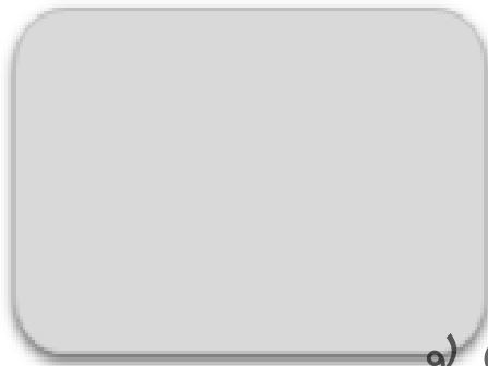
ทิศเหนือ